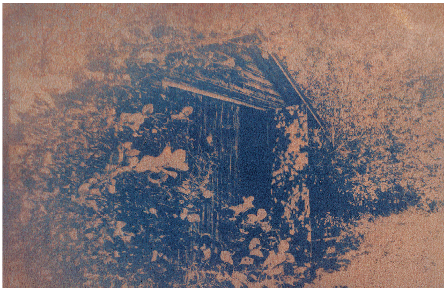
La grange aux « étranglas ». Cyanotype tonifié aux cerises de Virginie.

Pour en faire des desserts, les baies déshydratées pouvaient être mélangées à de l'eau d'érable, de la farine, de la graisse, etc. Elles pouvaient également être intégrées au pemmican , un mets traditionnel consistant