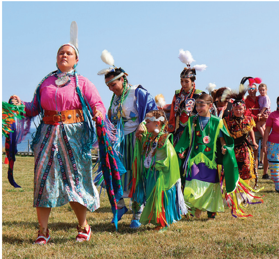
La régalia reflète l'identité de la personne qui s'en recouvre.