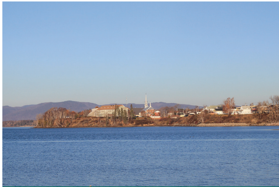
Le secteur sud du centre-ville de New Richmond, près de l'église et de l'hôtel de ville, sera à protéger avant longtemps.

Le secteur de l'Île, à Saint-Siméon, et la zone située à la limite municipale de Hope Town et de Saint-Godefroi, où la falaise s'est rapprochée de quelques maisons, représentent d'autres endroits à surveiller dans un avenir prévisible.