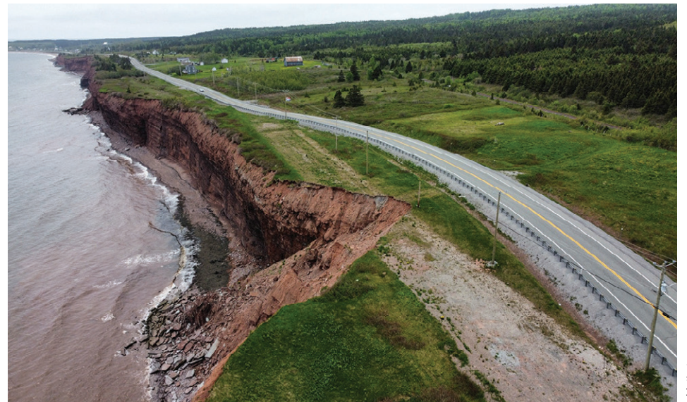
Des portions de route près des côtes sont à risque, comme sur cette photo prise à L'Anse-à-Beaufils.

Comme son homologue dans La Côte-de-Gaspé, il déplore le manque de prévention. « Le ministère est plus dans la réaction à l'urgence que dans la prévention. À l'interne, on en parle et ça nous préoccupe, mais pas de façon majeure, avoue-t-il candidement. On n'a pas encore pris le dossier par les cornes pour le moment, mais il faudra le faire un jour. »