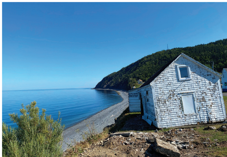
Des anciens chalets touristiques entre la mer et la rue des Touristes à L'Anse-à-Valleau devront être démolis ou déplacés.

« On détermine des zones très susceptibles où on ne pourra plus se construire à l'avenir pour éviter que les gens subissent des périls ou risquent de se faire délocaliser, précise Daniel Côté. On est mieux de le faire en amont avec une bonne planification parce qu'au Québec, on agit très peu de manière préventive. On agit souvent quand la maison est en train de tomber dans la mer, même si ça coûte plus cher de réparer que de prévenir. »