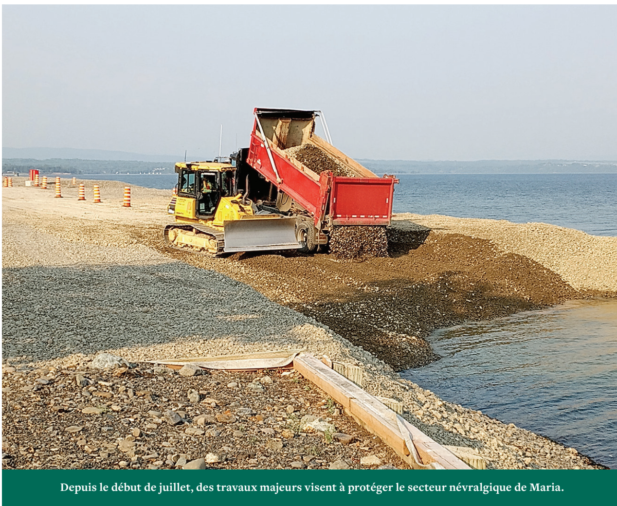
Depuis le début de juillet, des travaux majeurs visent à protéger le secteur névralgique de Maria.