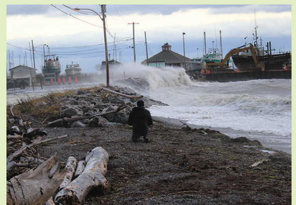
La submersion côtière se juxtapose parfois à l'érosion proprement dite, quand des vents exceptionnels et une marée très haute ragent, comme le 1er novembre 2019 à Carleton-sur-Mer.

La tombée du journal devant être respectée, certaines réponses, du moins nous l'espérons, seront disponibles dans la page Repère de GRAFFICI en novembre. « Plan climat, scénarios à prévoir pour 2035 et 2045, autres endroits à surveiller, possibilités de déplacements de routes, de maisons, autres recharges de plages, qui paiera quoi », bref, nous y reviendrons.