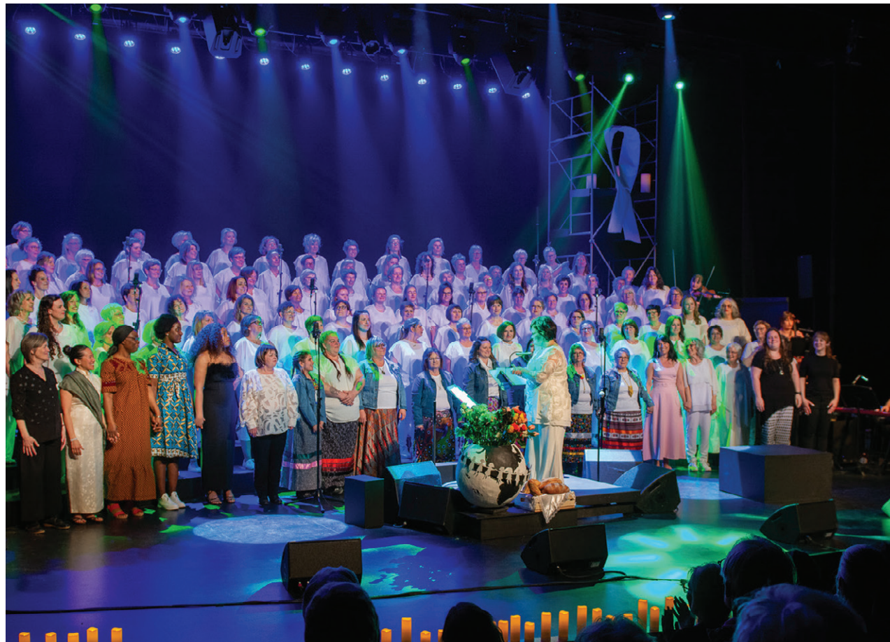
Environ 150 femmes sont sur scène pour le spectacle F .