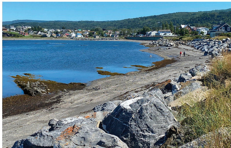
De l'enrochement a déjà été fait dans le secteur à l'est du quai, derrière la caisse Desjardins de Sainte-Anne-des-Monts.