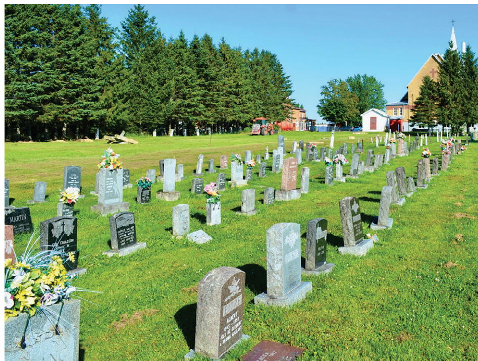
Le cimetière de Saint-Alexis-de-Matapédia révèle une histoire méconnue de l'Acadie, vieille de 165 ans.