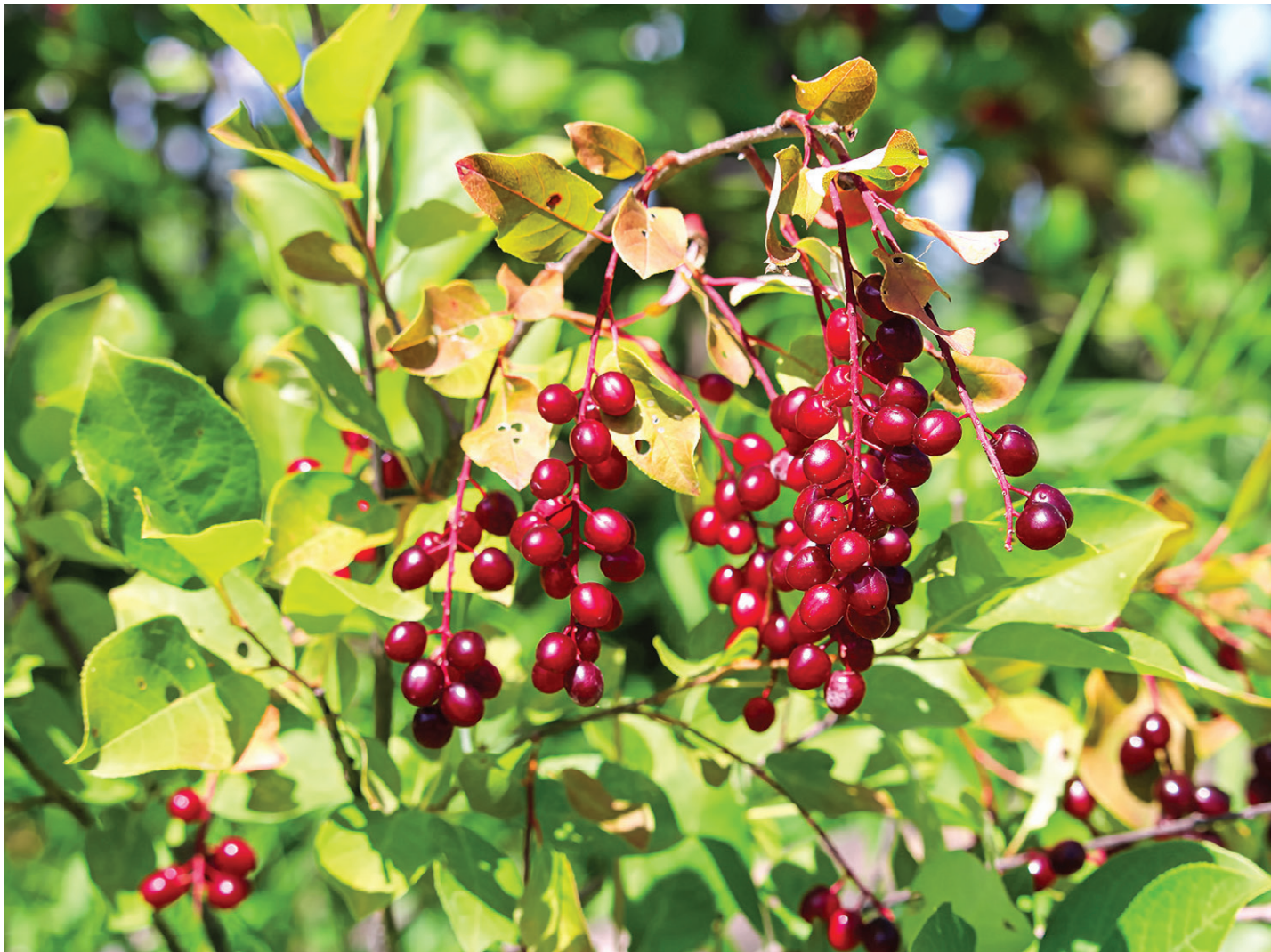
Le cerisier de Virginie ( Prunus virginiana ), qui produit des drupes qu'on appelle parfois cerises à grappes, cerises sauvages, chokecherries, ou poqwa'lamgewei en mi'gmaq.

NEW CARLISLE | Vous savez, ces petites baies violacées qui connaissent leur maturation optimale en ce temps de l'année et qui sont très astringentes? Bien connus des peuples autochtones d'Amérique du Nord ainsi que des Québécoises et Québécois, les «étranglas» furent de tous temps transformés en vue de leur consommation ou pour leurs vertus médicinales. Quelques paroles échangées avec les Gaspésiennes et Gaspésiens révèlent qu'ils y ont également pris goût. Portrait d'un petit fruit qui, lui aussi, réussit à changer l'eau en vin.