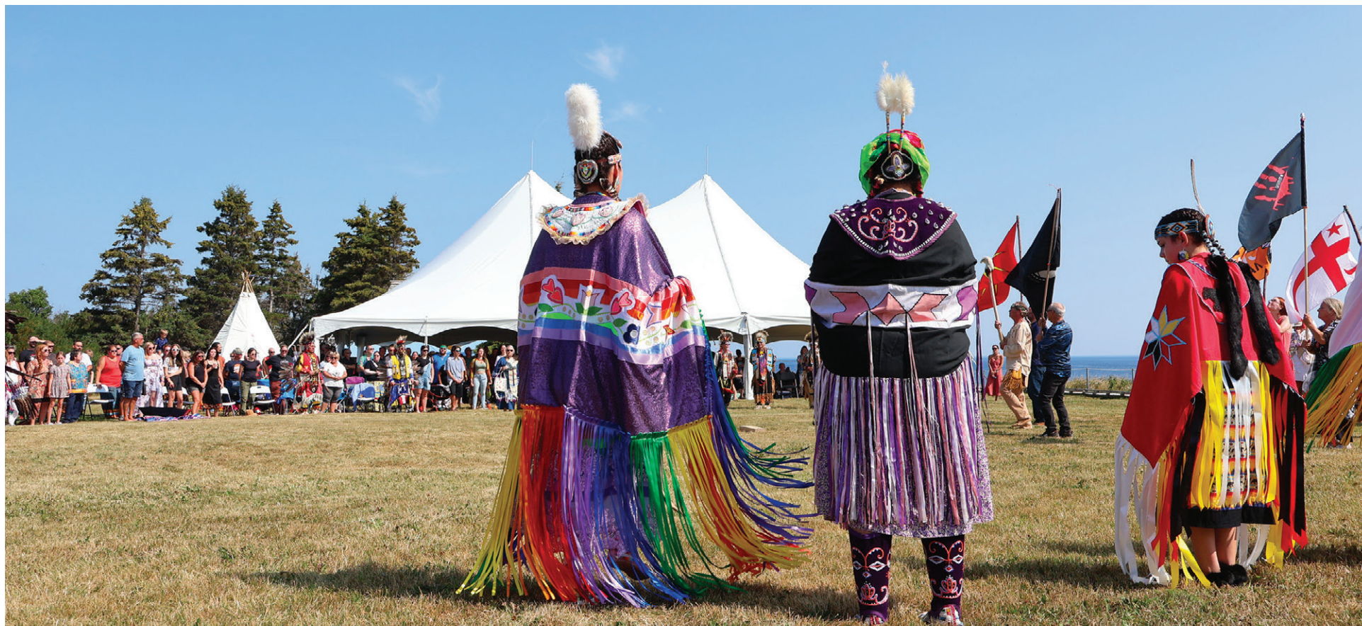
La danse, volet important du Mawiomi, est une manière de célébrer la culture des communautés autochtones.

Arborant une régalia – le vêtement sacré des danseurs et danseuses – dont elle signe la