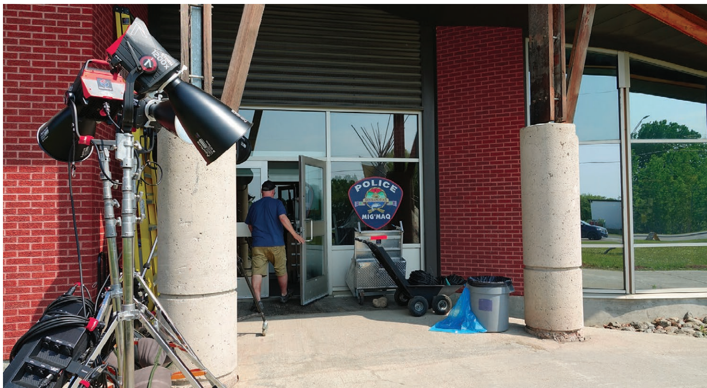
L'équipe de tournage de la série Bon Cop, Bad Cop a posé ses caméras dans la communauté autochtone de Gesgapegiag.