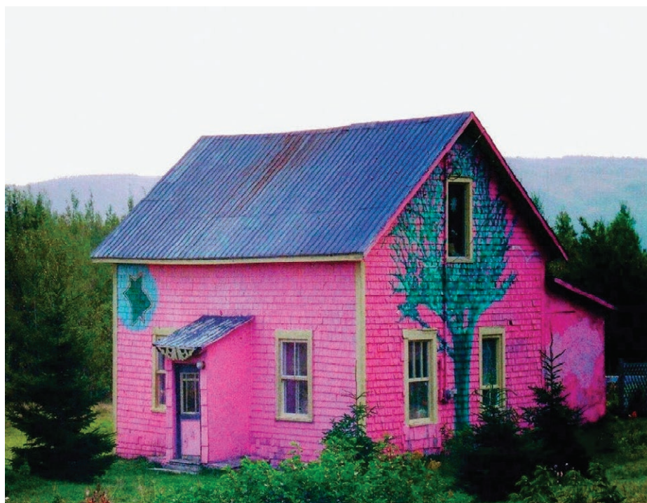
La vraie petite maison rose où a grandi Valentine Goddard et qui a servi d'inspiration pour le musée virtuel interactif du même nom.