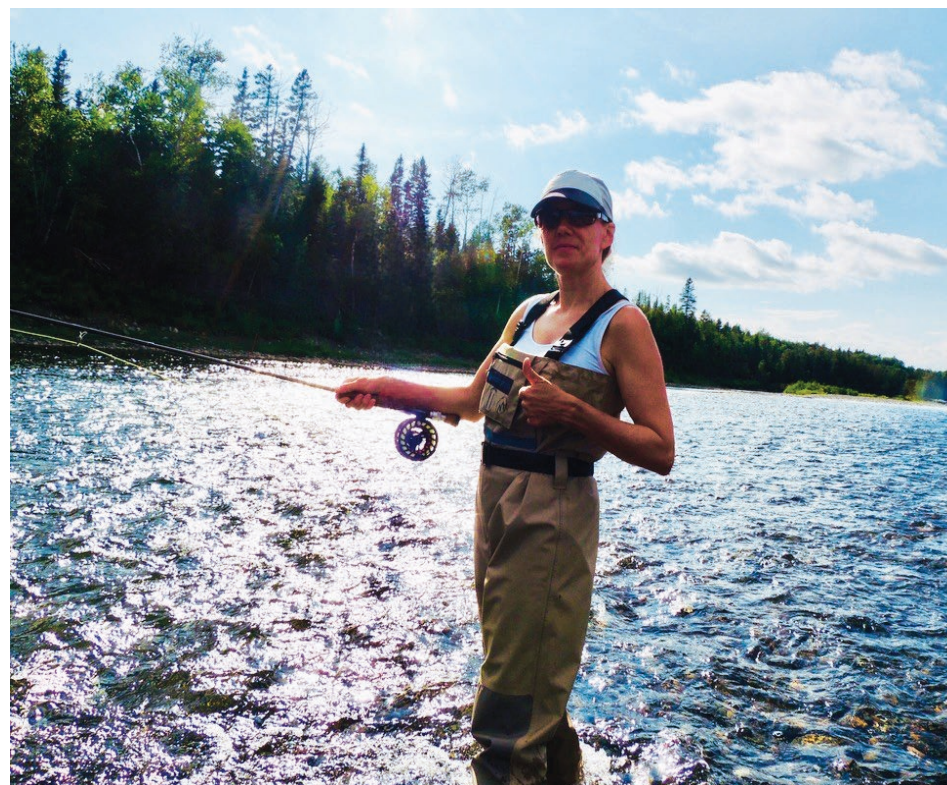
Notre chroniqueuse et sa fierté de faire ses premiers lancers de pêche au saumon dans la rivière Bonaventure.