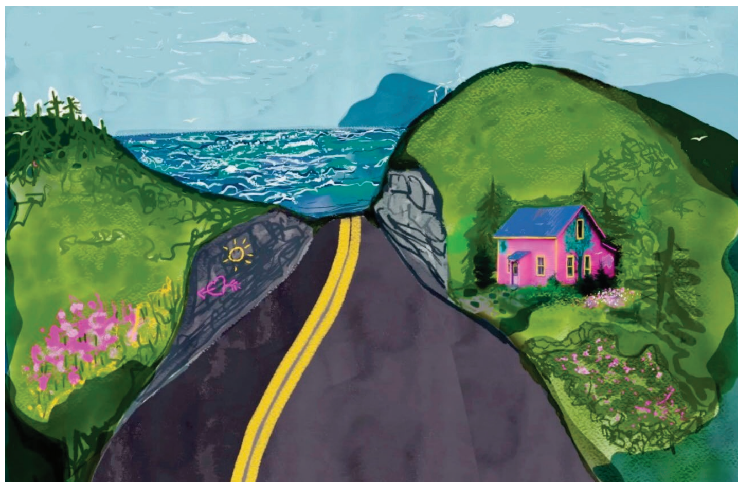
La page d'accueil de La Petite Maison rose, dont l'illustration a été créée par Valentine Goddard.

est donc une réplique virtuelle de la maison de M me Goddard, l'internaute est invité à jouer à « l'horoscope gaspésien ». Le jeu est composé de 12 questions associées à autant d'animaux, d'insectes, d'oiseaux et de mollusques dont la région regorge. La personnalité propre à chacun d'eux guidera le visiteur vers des visites et des sorties.