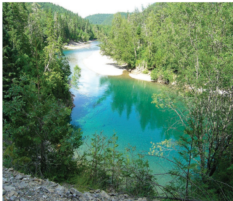
La rivière Bonaventure dans la Baie-des-Chaleurs où notre chroniqueuse a expérimenté la pêche au saumon pour la première fois.