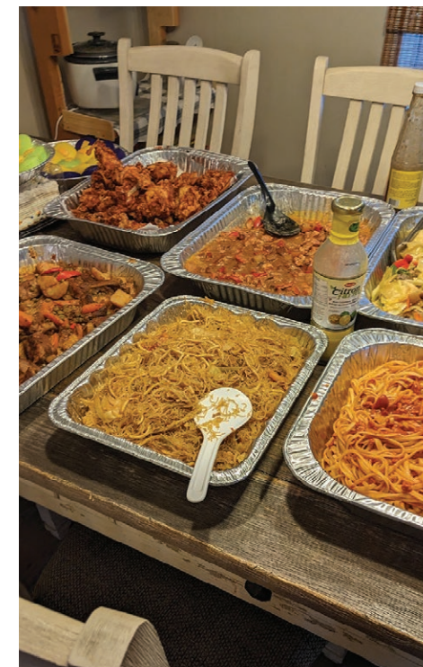
Une table pleine de plats philippins avait été préparée lors la soirée à laquelle était invité GRAFFICI.