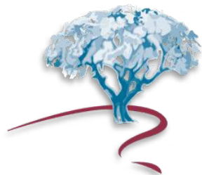
TABLE RÉGIONALE DE CONCERTATION DES AÎNÉS GÎM