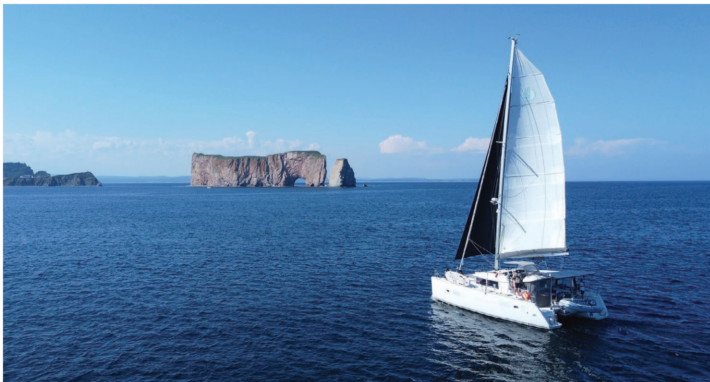
Le voilier Vanamo devant le rocher Percé