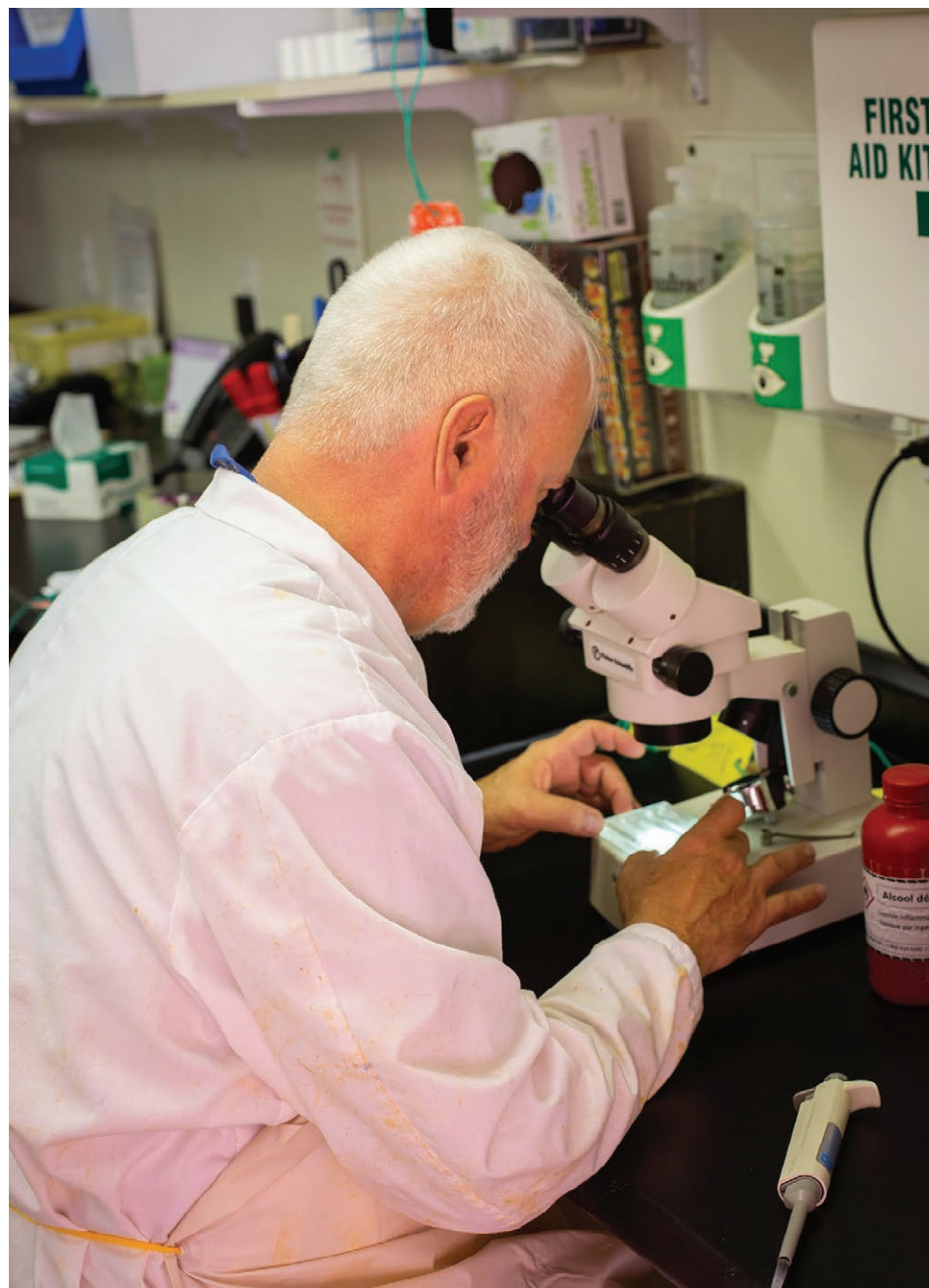
Le travail se fait tant à l'extérieur qu'en laboratoire.